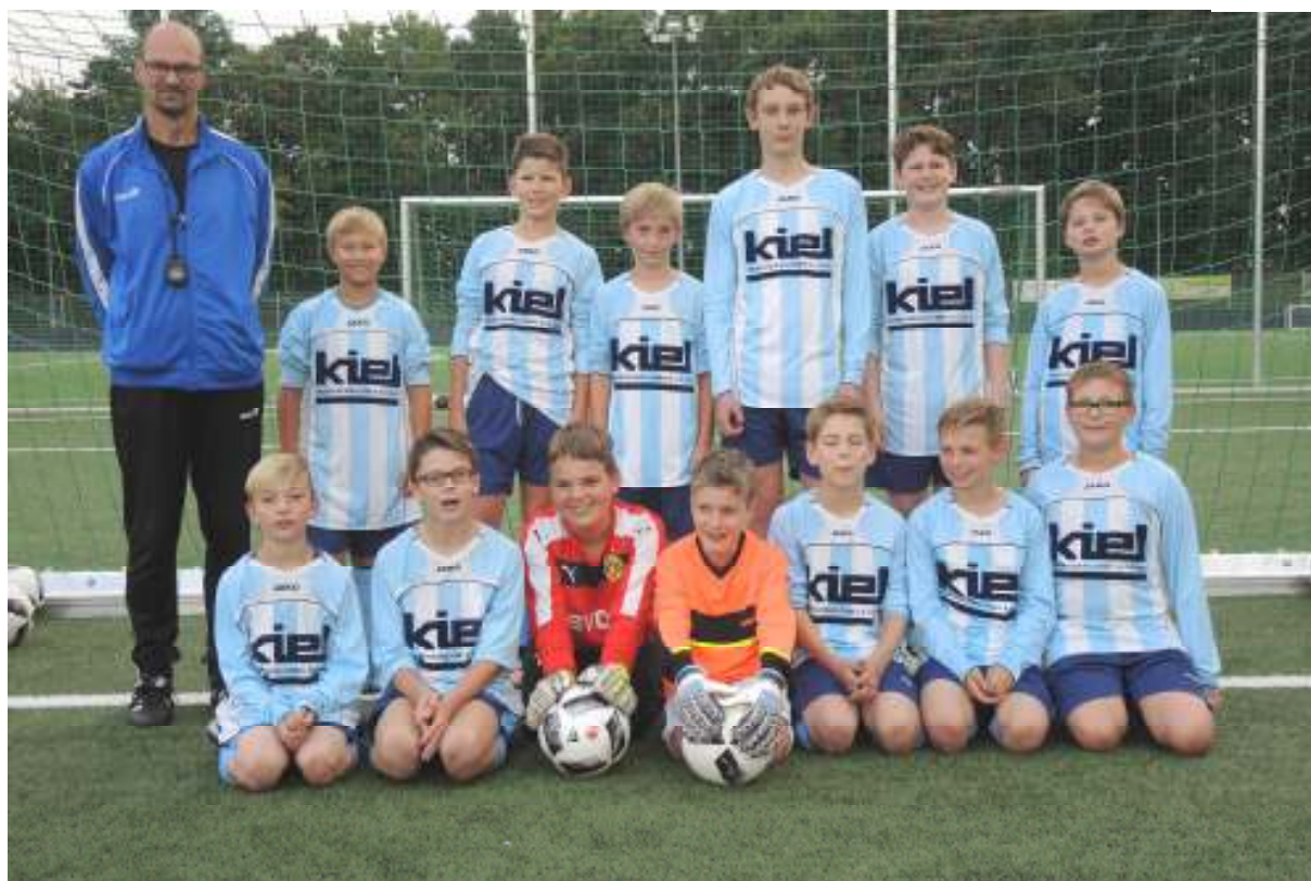
D-Jugend Spielzeit 2016/2017