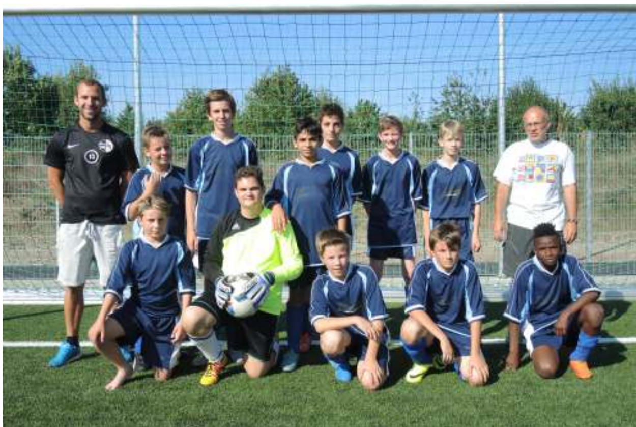
C-Jugend Spielzeit 2016/2017