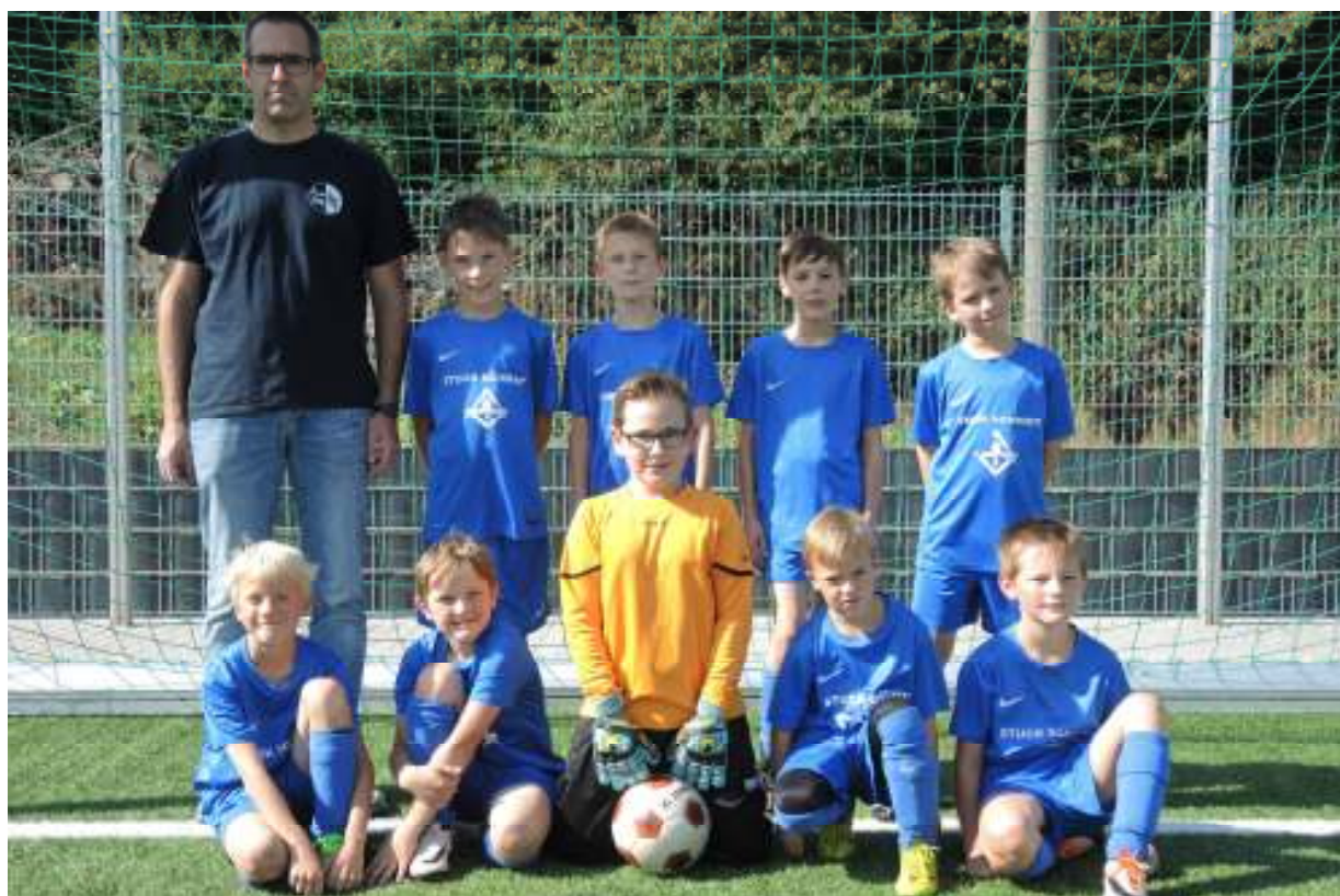
E-Jugend Spielzeit 2016/2017