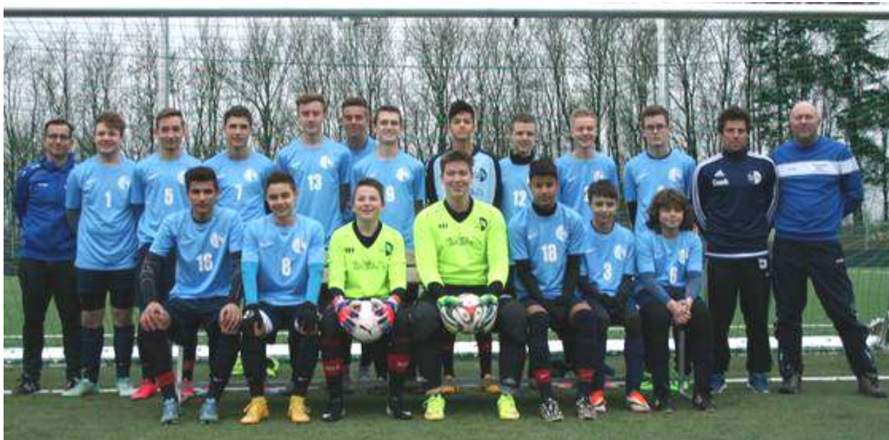
B-Jugend Spielzeit 2016/2017