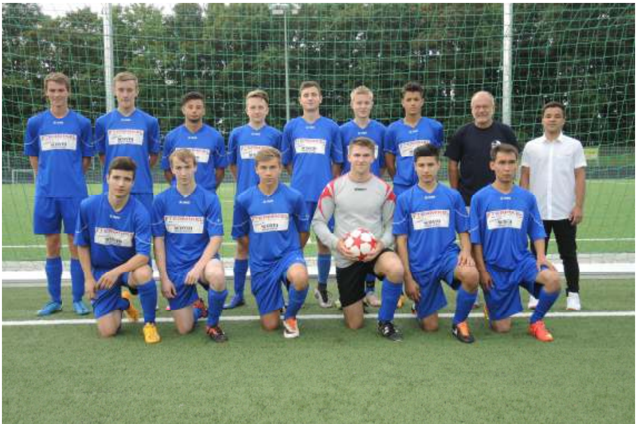
A-Jugend Spielzeit 2016/2017